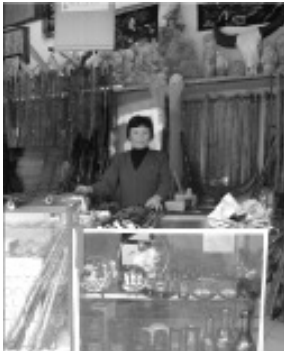
옥병의 한 소적 판매점

중국의 조그마한 옥병이라는 현에서 옥병 소적을 세계에서 요구하는 전통성과 예술성을 겸비한 악기로 발전시키겠다는 마음을 가지고 옥병의 문화상품으로 키우겠다는 의지를 보여준다는 것은 우리의 악기 제작 방식이나 상품개발, 판매 망 구축 등을 고려할 때 충분히 참고할 만한 가치가 있으리라 생각되었다. 우리도 악기들의 제작과 출품, 기증에 대한 철저한 조사로 한국의 새로운 전통악기를 문화상품으로 제작하는데 많은 노력을 기울여야 할 것이다.