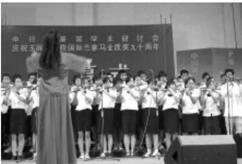
<중국 국제 옥병 소적 학술연토회> 개막식 기념 연주회 한 장면

21세기에 중국 옥병의 적소가 어떻게 새로운 발전을 해야 할지 모색하기 위해 열린 <중국 국제 옥병 소적 학술연토회>(中國國際玉屏簫笛研討會)는 아주 의미 있는 학술대회였다. 통소와 적자를 가지고 옥병 통소의 재발전 기회를 삼으려는 현의 의지도 놀라웠으나 무엇보다 한국 전통음악의 미래를 생각해 볼 수 있는 자리였다는 것이다. 특히 '문화상품으로서 어떻게 한국 전통악기를 가공할 것인가' 하는 문제는 학술대회가 던져준 큰 화두이다.