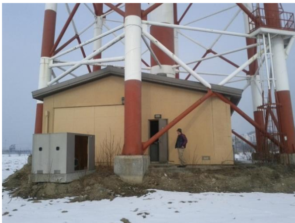
▲ 취수탑 기계실과 내부