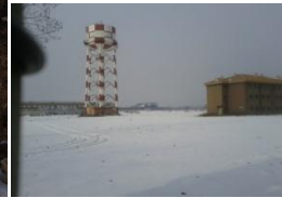
▲ 취수탑+장교 숙소