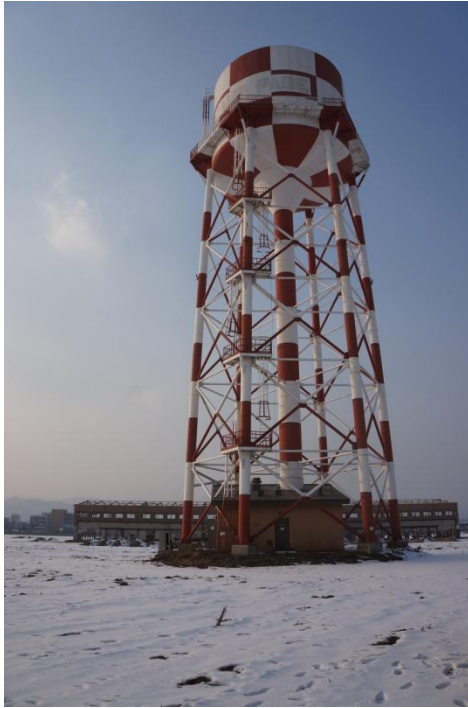
▲ 취수탑 전경