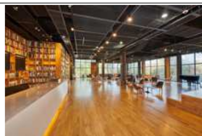
문발살롱 차, 다과 등을 즐기는 카페