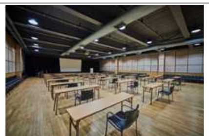
대회의실 등 강연, 행사 진행 공간