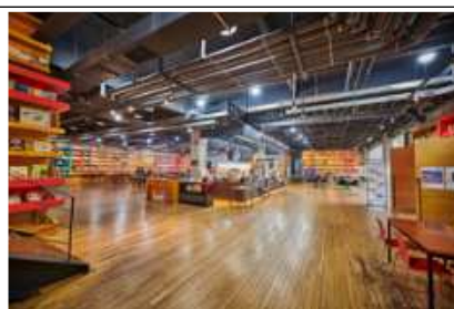
파주 지혜의숲 도서 10만 여 권 열람 가능