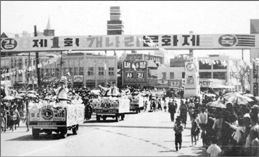
▲ 제1회 개나리 문화제 시가행진 모습을 담은 흑백 사진.